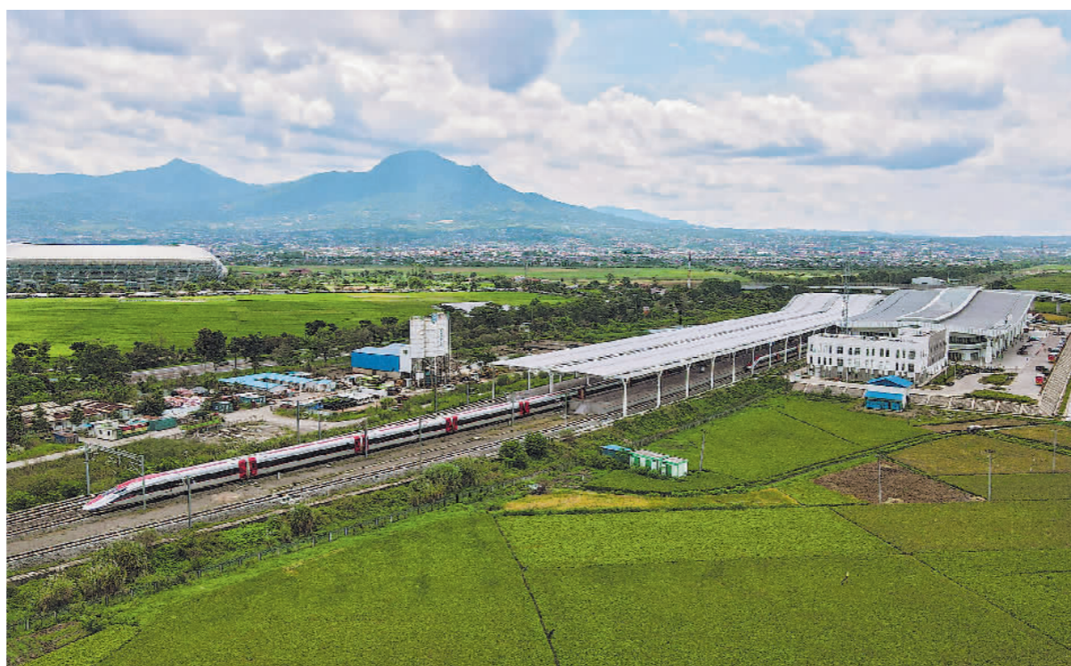
▲当地时间4月17日,在印度尼西亚万隆隆卡鲁尔站,一列雅万高铁高速动车组驶出站台(无人机照片)。