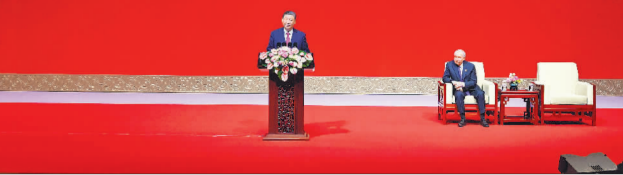
5月16日下午，国家主席习近平和俄罗斯总统普京在北京国家大剧院共同出席“中俄文化年”开幕式暨庆祝中俄建交75周年专场音乐会并致辞。

Торжественная церемония открытия Годов культуры России и Китая - концерт в честь 75-летия новления дипломатических отношений между двумя странами