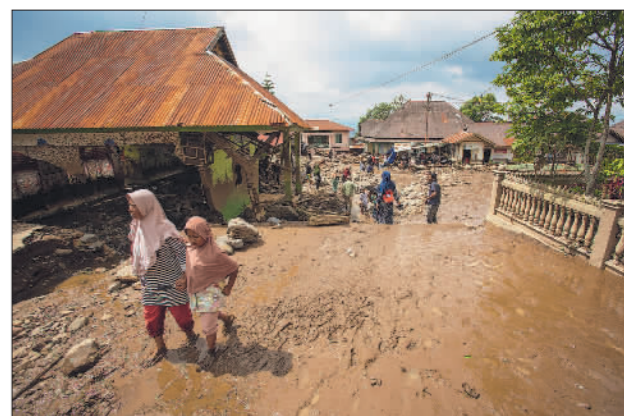
印尼西苏门答腊省发生洪灾

张振克认为,非洲各国不仅需要继续补齐基础设施短板,更重要的是有效挖掘并开发各国丰富的旅游资源,释放更大吸引力。同时,在跨国公司着眼抢占非洲旅游市场的形势下,“非洲国家要加强旅游人才培养和旅游管理自主性,在合作交流中争取更多经济利益,这样才能为本国旅游业持续发展带来更大的推动力”。