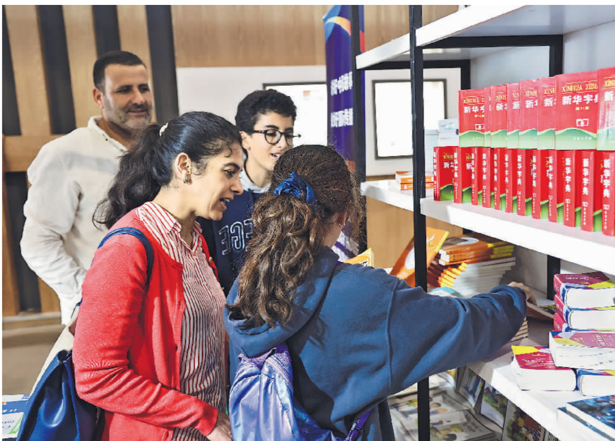
当地时间5月11日,人们在摩洛哥拉巴特国际书展的中国展台上选购汉语教材。