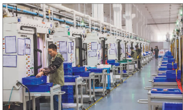
培育高新技术企业 助力高质量发展

职称评审权限下放的另一个目的，就是更好地对接行业特点和实际需求，人社部门树立一批优秀的职称评审第三方机构标杆，推动全市人才队伍建设的健康发展。为此，镇江市总工会积极寻求突破，努力探索新路径，结合产业工人的实际情况和需求，最大化发挥现有职称评审政策作用，制定科学、合理、可行的职称评审标准。“既注重考核申报人的专业技能和工作经验，又充分考虑其在技术创新、成果转化等方面的贡献。”胡云霞表示，市总通过主动问需服务企业，将职称评审惠企政策落实到企业、惠及职工。