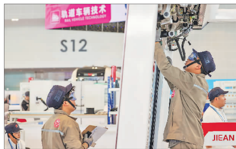
9月16日，轨道交通技术项目选手在紧张比赛。

此次大赛的赛项设置新意十足。与第一届大赛相比，本届大赛增加了20个新职业和数字技术技能类赛项，如全媒体运营、互联网营销等，这些赛项对于增强新职业从业人员的社会认同感、促进就业创业具有重要意义。同时，新增智能制造工程技术、人工智能工程技术等5个专业技术类赛项项目，更加符合技术技能融合发展的趋势。