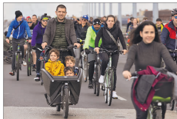
布达佩斯:骑行迎接地球日

当地时间4月20日,在匈牙利首都布达佩斯,人们参加自行车骑行活动。当日,匈牙利布达佩斯举办自行车骑行活动,倡导人们低碳出行,并迎接世界地球日的到来。今年4月22日是第55个世界地球日。