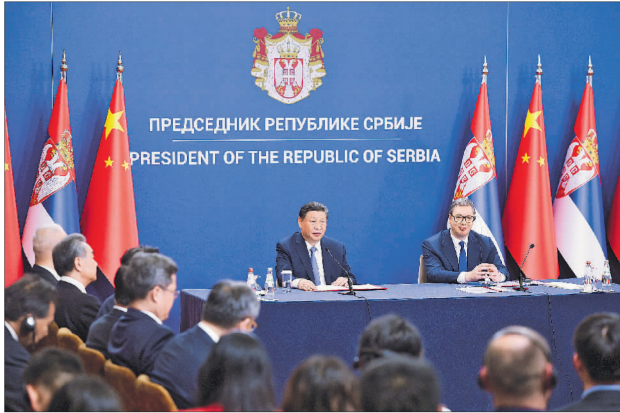
当地时间5月8日中午,国家主席习近平在贝尔格莱德塞尔维亚大厦同塞尔维亚总统武契奇会谈后共同会见记者。

新华社贝尔格莱德5月8日电(记者倪四义 刘华)当地时间5月8日上午,国家主席习近平在贝尔格莱德塞尔维亚大厦同塞尔维亚总统武契奇举行会谈。两国元首宣布,深化和提升中塞全面战略伙伴关系,构建新时代中塞命运共同体。